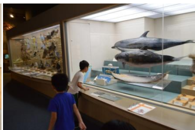
県立博物館（南極展）