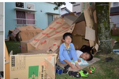
ダンボールハウス