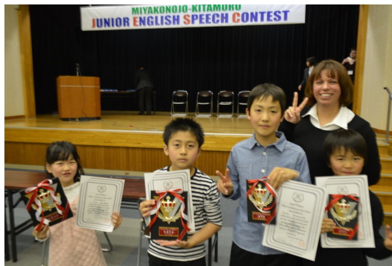
前回当校から参加した受賞者たち

尚、参加者を対象に何度か指導を兼ねて練習を行いますので、気楽な気持ちで挑戦してみてください。